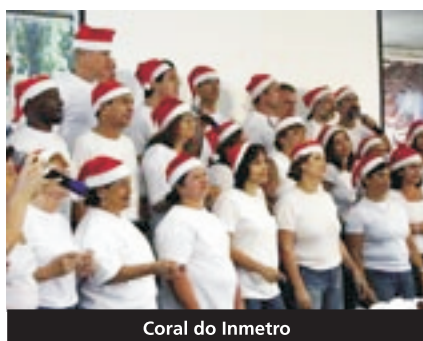
Coral do Inmetro