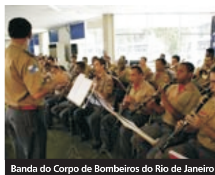
Banda do Corpo de Bombeiros do Rio de Janeiro